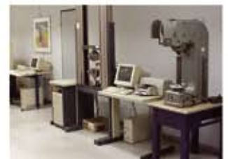
Controle van smelt op dichtheid, samenstelling en stoltraject. Trekproeven, hardheidsmeting